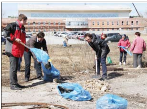
Заводчане с любовью прибрали улицы города, а жители домов с улицы Ал.Козицына – свои палисадники.