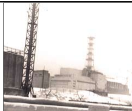
Вид на третий и четвёртый блоки ЧАЭС, декабрь 1986 года.

— В Чернобыль я также попал по долгу службы из Московского военного округа в должности командира взвода разведки. Военная специализация моя была связана с засечкой ядерных взрывов, поэтому