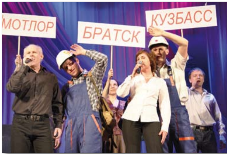
Комсомольские стройки собрал на сцене коллектив управления автоматизации.