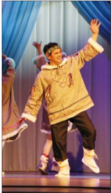
Весёлый чукча из цеха благоустройства.