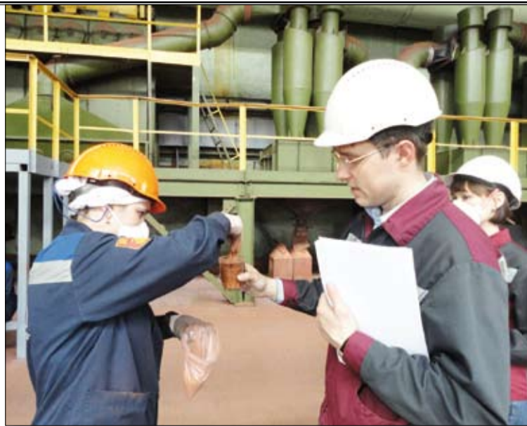
Проверить медный порошок на стабилизацию не составило большого труда.